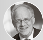
JOHANN N. SCHNEIDER- AMMANN