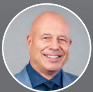
Fabio Regazzi Conseiller aux États, Président du CA, Regazzi Holding SA