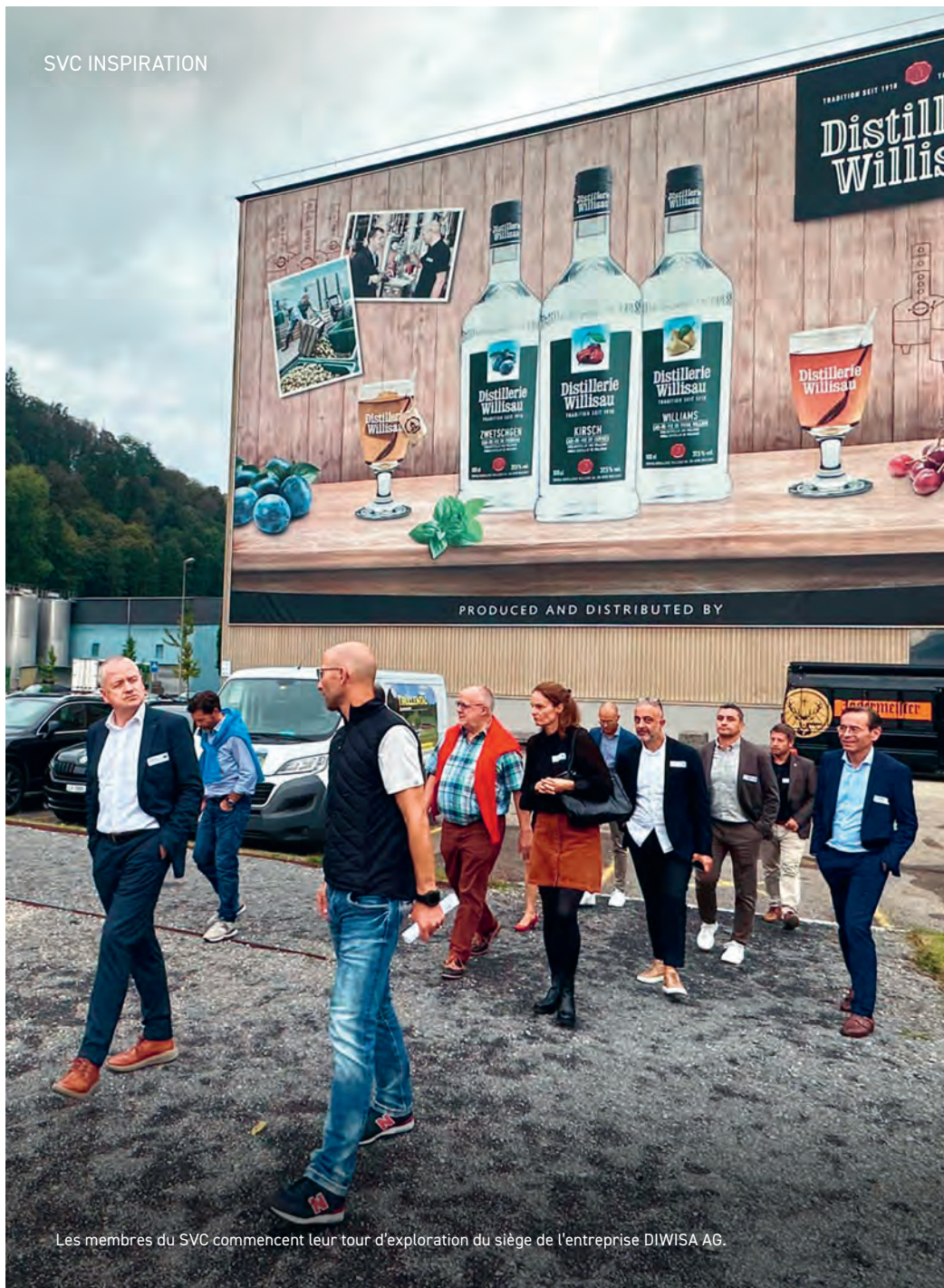
Les membres du SVC commencent leur tour d'exploration du siège de l'entreprise DIWISA AG.