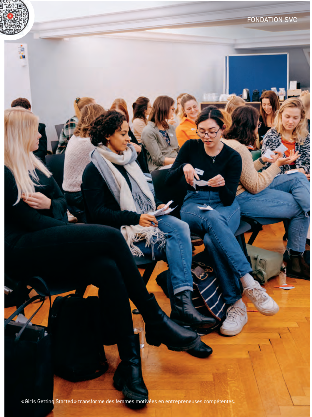
«Girls Getting Started» transforme des femmes motivées en entrepreneuses compétentes.