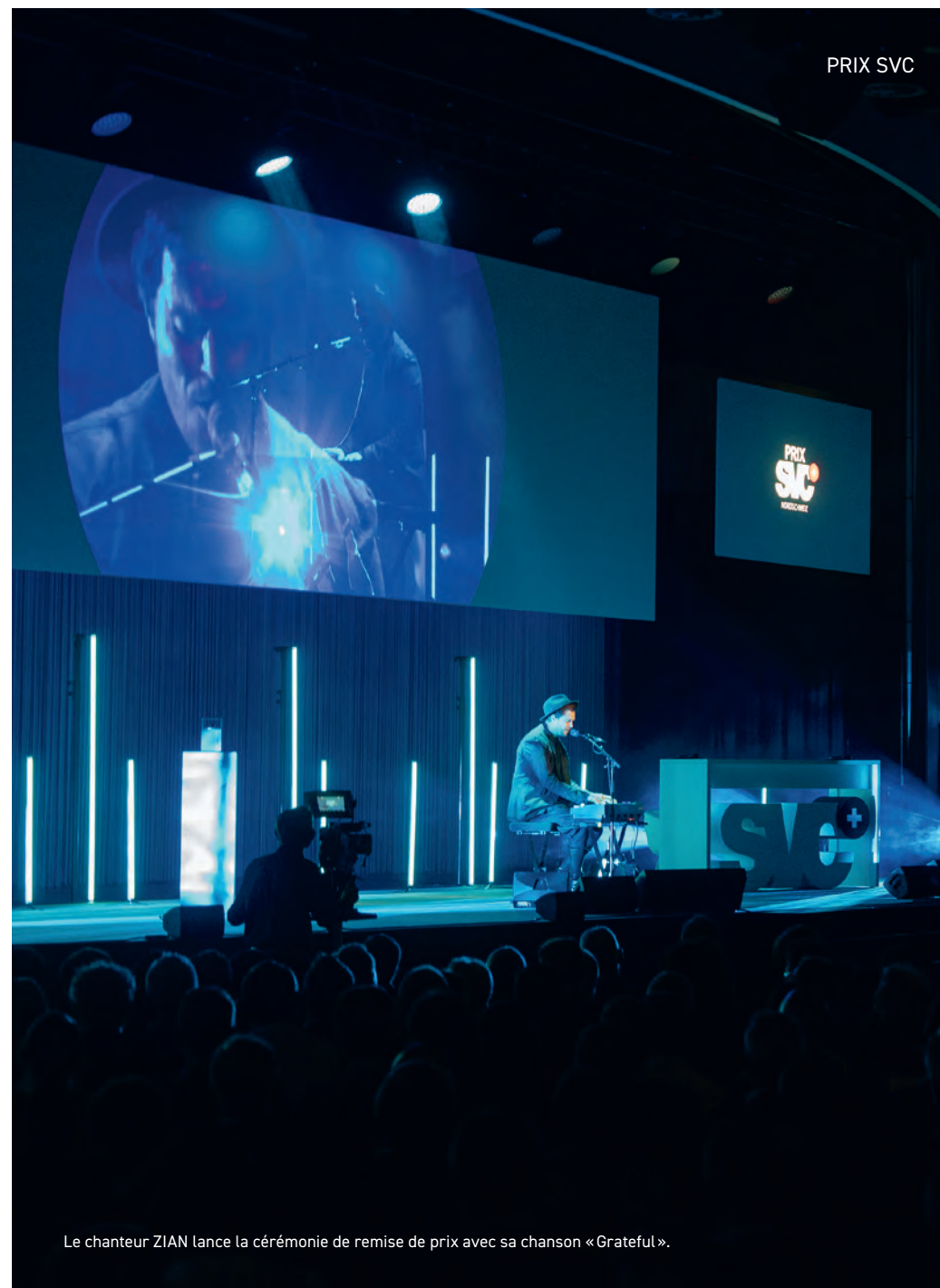
Le chanteur ZIAN lance la cérémonie de remise de prix avec sa chanson « Grateful ».