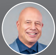
Fabio Regazzi Conseiller aux États, Président du CA, Regazzi Holding SA