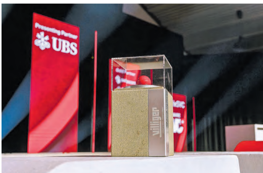
Der erste Prix SVC Aargau Solothurn ging an die Villiger Entsorgungssysteme AG.