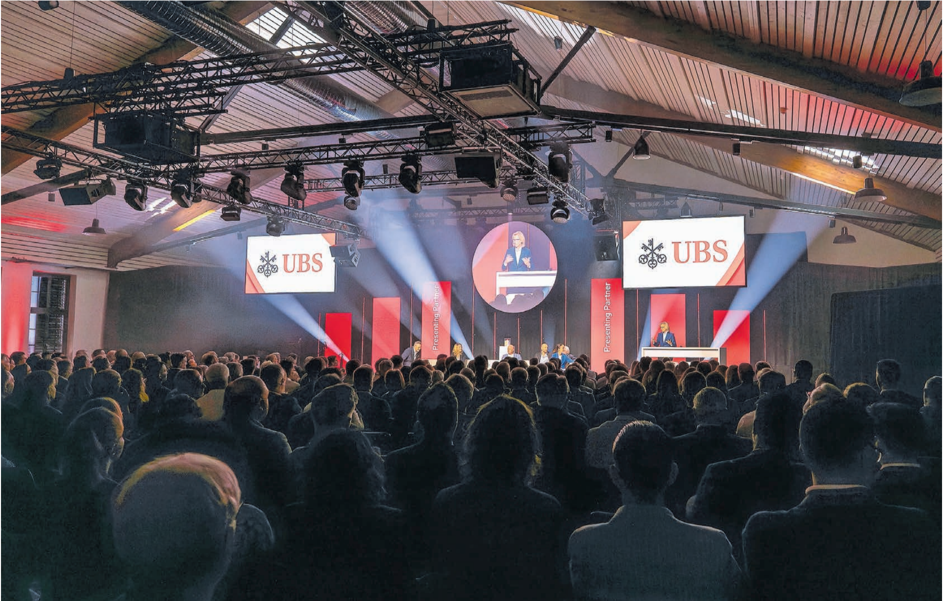
Rund 550 Gäste aus Wirtschaft, Politik und Gesellschaft verfolgten die Preisverleihung im Emil Frey Classic Center in Safenwil.