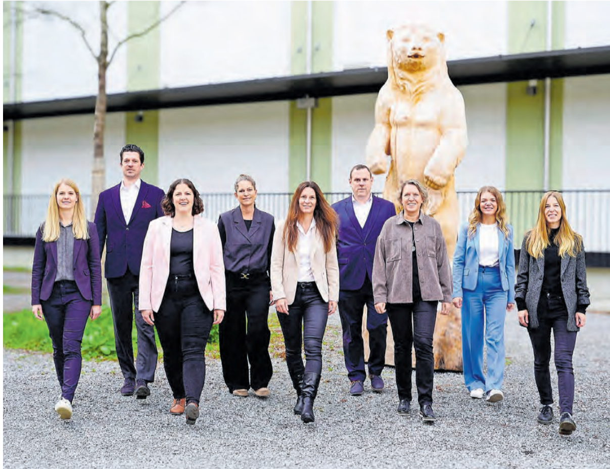
Das Team der SVC Geschäftsstelle will das KMU-Netzwerk in eine erfolgreiche Zukunft führen.